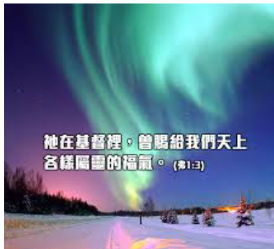
他在基督裡，曾賜給我們天上各樣屬靈的福气。(弗1:3)

今天你我已经真实悔改信靠主耶稣了，已经成为基督徒了，名字已经被记在神的生命册上了。但是因为不够认识我们所已经得