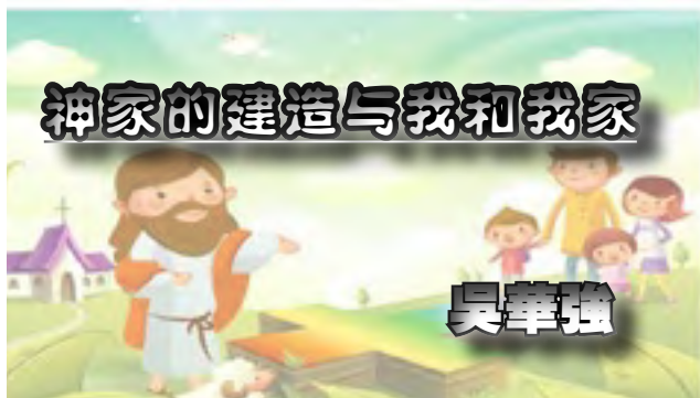
神家的建造--永远的旨意

神的家就是教会，神要得着祂的家，祂要住在祂的家，祂要建造祂的家，祂的教会，在创造万有之前，神已经有了祂的家。我们所信的神，是创造宇宙万物独一的真神，