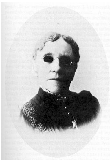
Fanny Crosby 1820-1915

她的祷告好像没有蒙主应允，但她一点不灰心，就是这样的倚靠救主，相信救主，知道主爱她，从来不怀疑，一直向神祈求。进入一所盲人学校读书和教书。忽然，有一天，一个陌生人从波士顿到这里来考察，看见芬尼所写的诗，觉得非常的惊讶，所以就帮助她，入一所盲人学校读书。她以大部份的时间研究音乐和文字；毕业以后，留校教书有十一年之久。在她教书的时候，学生们都非常的爱她，她也把救主的大爱传播在这些学生的心田里。许多年轻失明的孩子都因着她而清楚地蒙恩。凡因着和她接触而得救的人，都有一个相同点，就是和她一样地热爱救主，而且也都喜欢和主交通。主藉着她在那学校里成为一个